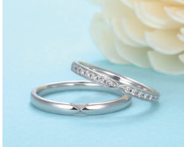
▲【アルタイル】PT950 左10万2000円・右13万3000 円、YG・PG 左6万4000円・右10万6000円