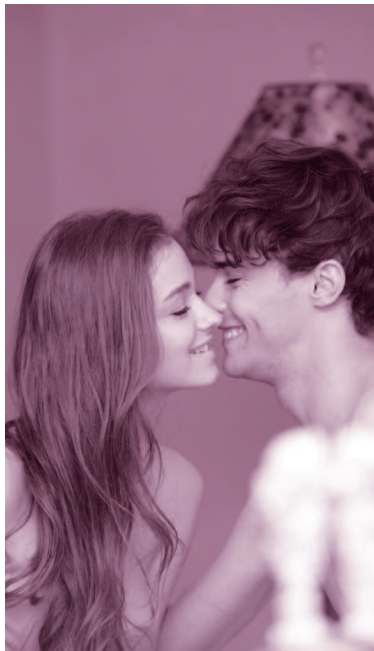
▲【Never ending story】Eternal Happiness 世界でたった一つの、愛の物語は永遠に続く