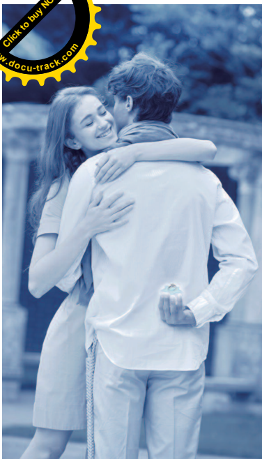
▲【プロポーズ】ひかれ合い、認め合い、形の見えない愛だから永遠の約束をリングに誓って