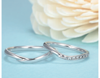
▲【ヴェスタ】PT950 左9万7000円・右10万7000円、 YG・PG 左6万円・右8万円

7starとシックレット starシリーズを提案 ブライダルジュエリー「星の 砂」には、7つのダイヤモンドに 願いを込めた「7star」シリ ーズと、ふたりのイニシャルを 石座に入れる「シックレット star」シリーズがある。現在 フェア開催中。「星の砂」購入者に オリジナルのメモリアルブックを プレゼント。毎月先着10名限定。