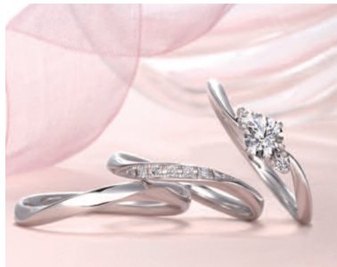
▲エンゲージは「アリア」、マリッジは「ディオオーネ」。 美しくしなやかなフォルムで指元を演出

7starとシックレット starシリーズを提案 ブライダルジュエリー「星の 砂」には、7つのダイヤモンドに 願いを込めた「7star」シリ ーズと、ふたりのイニシャルを 石座に入れる「シックレット star」シリーズがある。現在 フェア開催中。「星の砂」購入者に オリジナルのメモリアルブックを プレゼント。毎月先着10名限定。