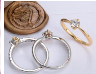
▲【シークレットスター】ダイヤを包むふたりのインシヤルカラーはピンク、イエロー、ホワイトから選べる