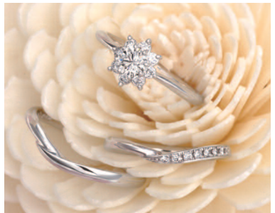
▲エンゲージは「フレア」、マリッジは「ヴェスタ」。セ ットで身に着ければ存在感が一層アップ