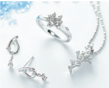
▲ネックレスやピアスなども展開している。「星の砂」はずっとお付き合いしたいジュエリーブランド

35ブランド扱フライトダイダル リングのセレクトショップ 様々な感性にピンとくるように に多彩なリングを揃えている専門 店といえばヴァンクールMAKI。 ロイヤルアッシュャーや鍛造リング、 パイロットリングほか全35ブラン ドと札幌でトップクラスの品揃え を誇るため、たくさんさんのショッ プを訪れなくても、ここだけで 一度に着け比べができる。