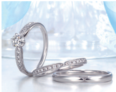
▲エンゲージは「アルビオレ」、マリッジは「アルタイ ル」。クラシカルなデザインで永く愛用できる