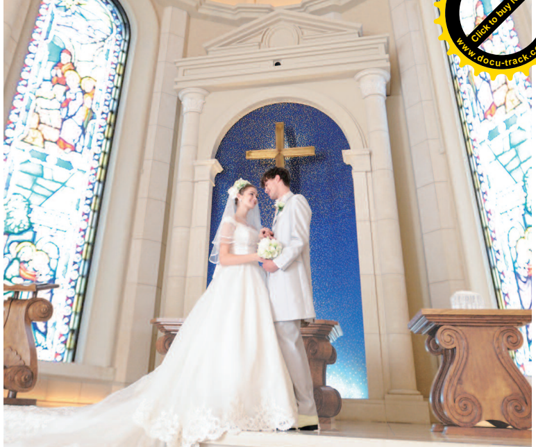
▲【星からの祝福】結婚を祝福するメッセージとして一つひとつのリングに星の名をネーミングしている