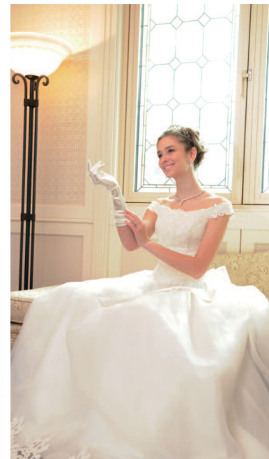
▲【憧れた運命的出会い】愛する人と永遠に続く幸せの予感…愛の軌跡がここから始まる！