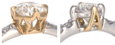
▲石座を星型にデザイン している「ステラ」 ▲ふたりのイニシャルで 石座をデザインできる

①ダイヤモンドは全てGカラー以上、VSク ラリティ以上、トリプルエクセレント、ハ ート&キュービッド②リング素材に隕石か ら採取したイリジウムを配合③着け心地 の良い内甲丸仕様④リング素材の地金はブラ チナ、イエロー、ピンクゴールドで作成可能 ※鑑定機関は全て中央宝石研究所