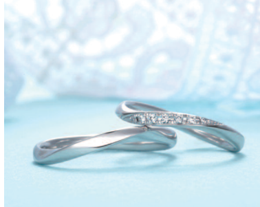
▲【ディオオーネ (7star)】PT950 左10万3000円・右11 万6000円、YG・PG 左6万9000円・右8万7000円