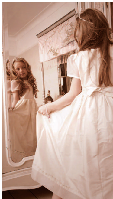
▲【星に願いを】運命の人を夢見た頃、流れ星に祈った未来の幸せ。純粋な気持ちを今も大切に