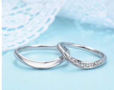
▲【クレセント (7star)】PT950 左11万8000円・右12 万6000円、YG・PG 左7万6000円・右9万3000円