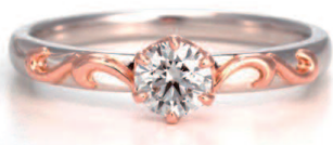
▲【ヴィーナス】「重ね続けるふたりのストーリー」 PT950 20万5000円、YG・PG 19万3000円