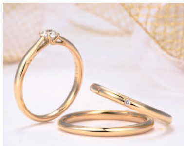
▲すべてのエンゲージリング、マリッジリングがピン クゴールドまたはイエローゴールドで作成できる